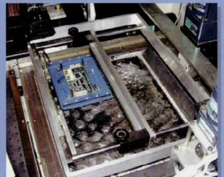
■はんだ槽部：パンプ噴流