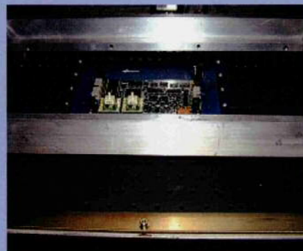
■高効率プリヒータ部