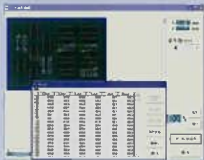
■ オフラインティーチング (パソコンソフト)