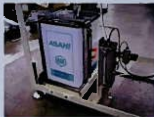
■ 18L フラクサータンク