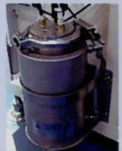
■ 2L フラクサー金属タンク